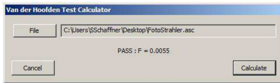
Abb.2 Van der Hoofden Test Calculator Software

Fig. 2 Van der Hoofden Test Calculator software